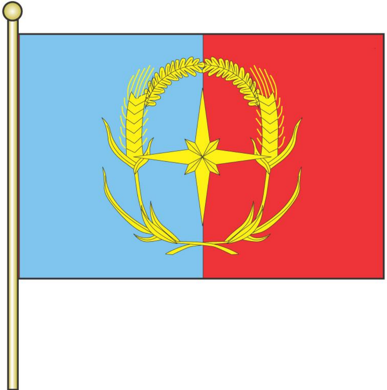
Рисунок флага Андроповского муниципального района Ставропольского края