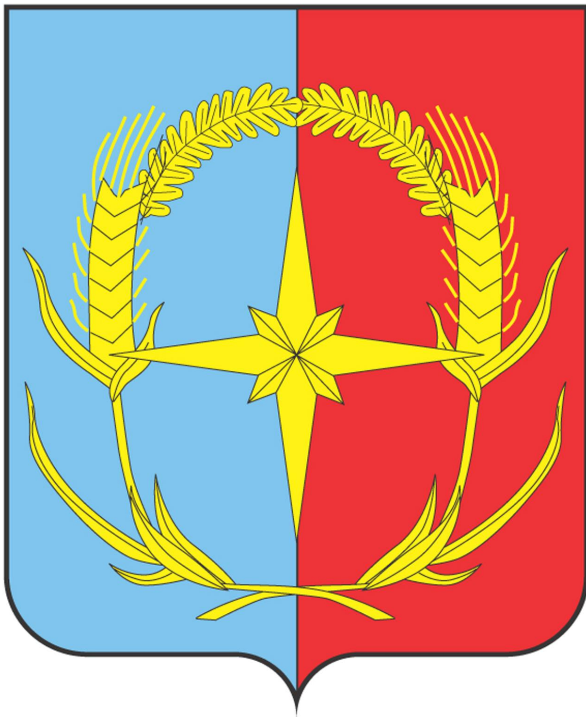
Рисунок герба Андроповского муниципального района Ставропольского края в цветном варианте